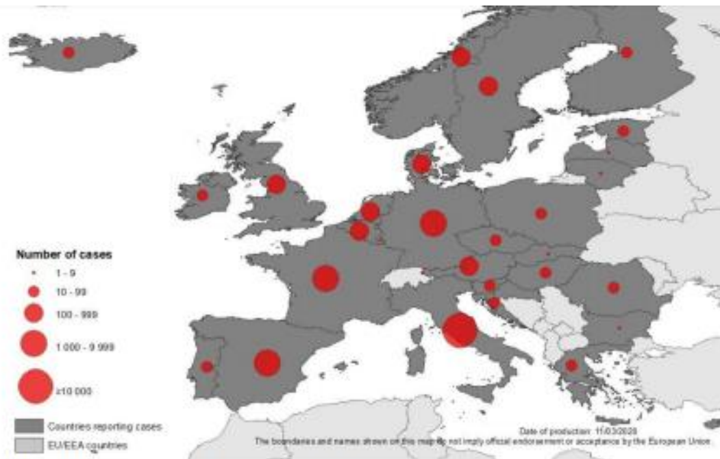
Geografska raspodjela slučajeva u Europi