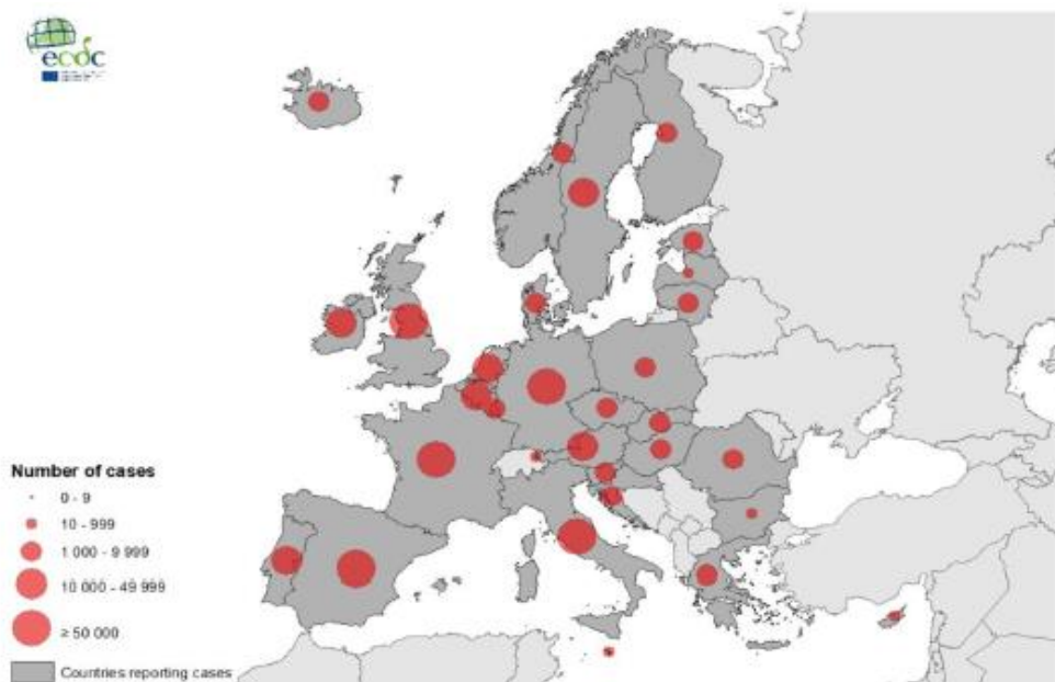
Geografska raspodjela slučajeva u Europi