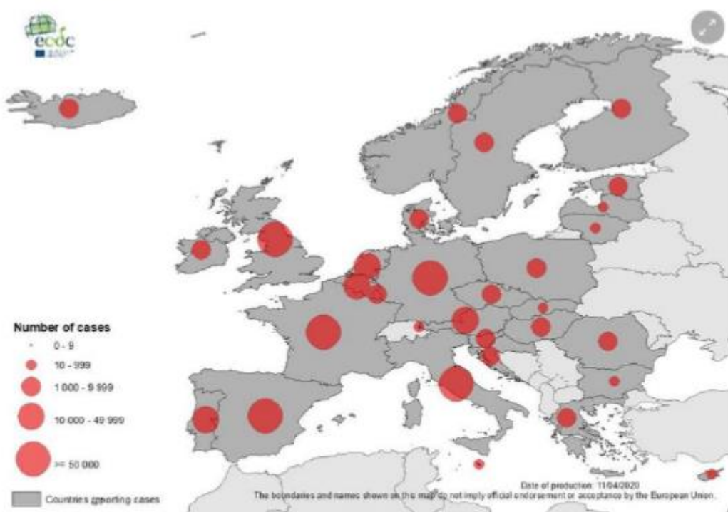
Geografska raspodjela slučajeva u Europi