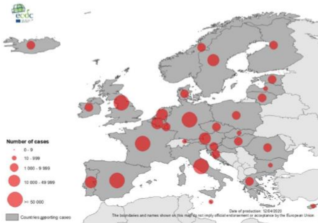
Geografska raspodjela slučajeva u Europi