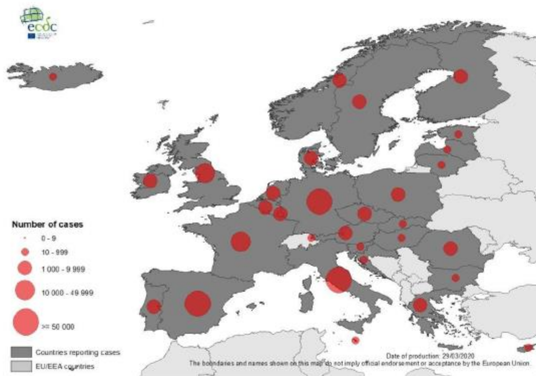
Geografska raspodjela slučajeva u Europi

Prema Europskom centru za prevenciju i kontrolu bolesti (ECDC), JHU, NCC-a i podacima Hrvatskog zavoda za javno zdravstvo (HZJZ), dana 29. ožujka do 06:00 sati u svijetu je zabilježeno 722.435 laboratorijski potvrđenih slučajeva koronavirusa (2019-nCoV), 142.356 u USA, 97.689 u Italiji, 82.149 u Kini. Broj smrtnih slučajeva u svijetu porastao je na 33.984. Broj oporavljenih u svijetu je 151.901.